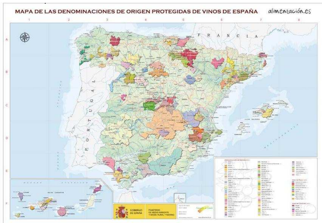
Figura 1. Mapa de las Denominaciones de Origen de España

El sitio web www.winesfromspain.com 2 hace hincapié en la importancia que tiene el sector del vino para España, no sólo desde el punto de vista económico sino también desde el punto de vista social y medioambiental. A modo de resumen, los siguientes datos que se muestran son aclaratorios: