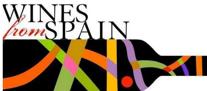
Figura 3. Nueva imagen de Wines from Spain

Es precisamente Wines from Spain la entidad que ha redoblado esfuerzos en la última década para unificar las imágenes y los mensajes publicitarios sobre el sector del vino lejos de nuestras fronteras. En 2003, se tomó la decisión de cambiar la imagen corporativa, un proceso que se vio implementado en 2005 y que consiguió el objetivo de favorecer la internacionalización de los vinos españoles a través de una marca común y prestigiosa (Del Rey, 2010).