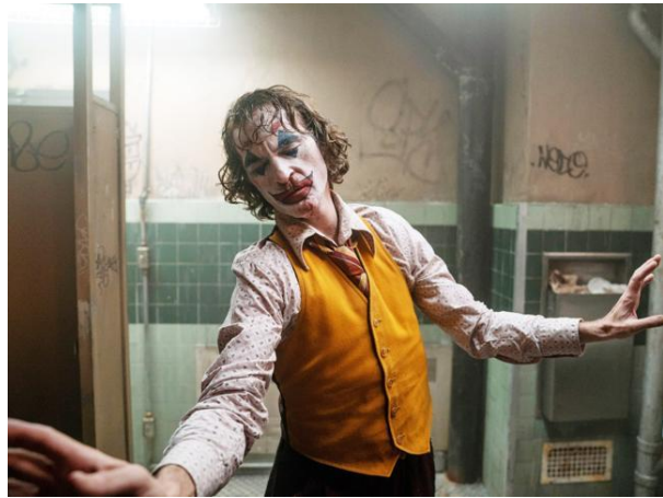
Figura 6: Joker (2019) Dir: Todd Phillips

Cual difunto, Arthur Flake parece descender al Hades. El paisaje de oscuridad, violencia, fuego y muerte sirven como escenario para la escena del accidente final. Podemos creerlo muerto, resto, sobre el capote del carro; pero cual siniestro fénix será rescatado de sus cenizas por otros, semejantes, que cual imagen en el espejo, le devuelven una imagen grandiosa de sí, descubriendo un mundo apocalíptico, como aquel donde surgiera el Ankoku butō .