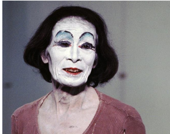
Figura 5: Kazuo Ohno(1906-2010)

Una danza de ruptura, nacida "dentro del contexto de posguerra en un Japón en ese entonces devastado (... donde había) proliferación de espacios en los que se revelaban, por un lado, la caída de los valores que anteriormente habían regido la vida cotidiana y, por otro, la necesidad y el deseo de creación de algo nuevo" 20