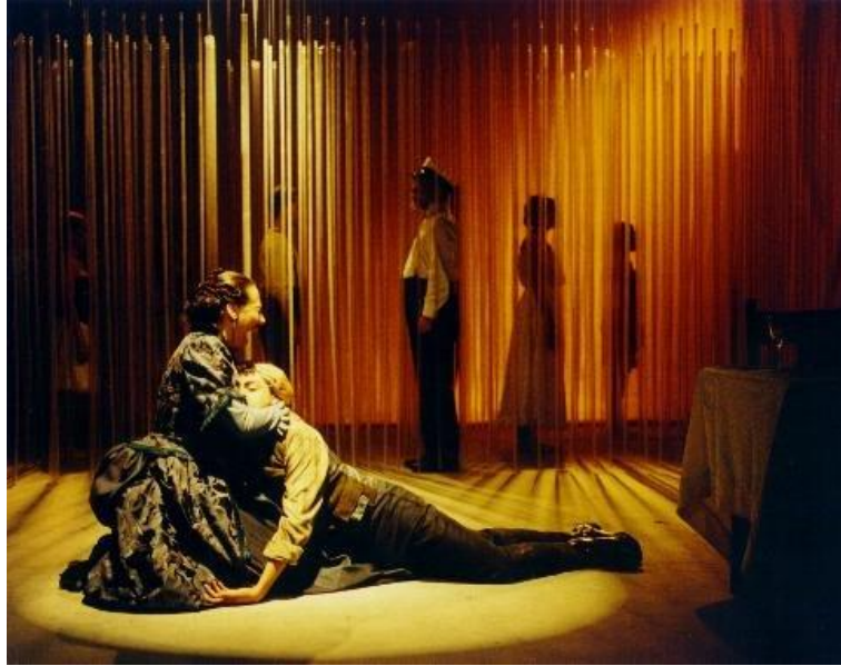
Figura 2: Espectros de H Ibsen Dirección Johnny Gavlovski. Sala Rajatabla, 1999

Todo esto nos lleva Joker (2019), guión creado para cine por Todd Phillips y Scott Silver, y dónde un profundo suspiro de alivio, calma el horror que recorre a los espectadores, cuando entienden que el protagonista, Arthur Fleck, no comete un terrible matricidio, sino que por el contrario, hace justicia con una mujer que no es su madre, y que además permitió lo abusaran de niño. Es decir, el crimen en su connotación moral aparece en nuestros ojos matizado, elevado a la categoría de pretexto; entrando así en una serie de justificaciones del mismo tenor, desde el momento mismo en que se entiende porque Fleck se comporta como lo hace.