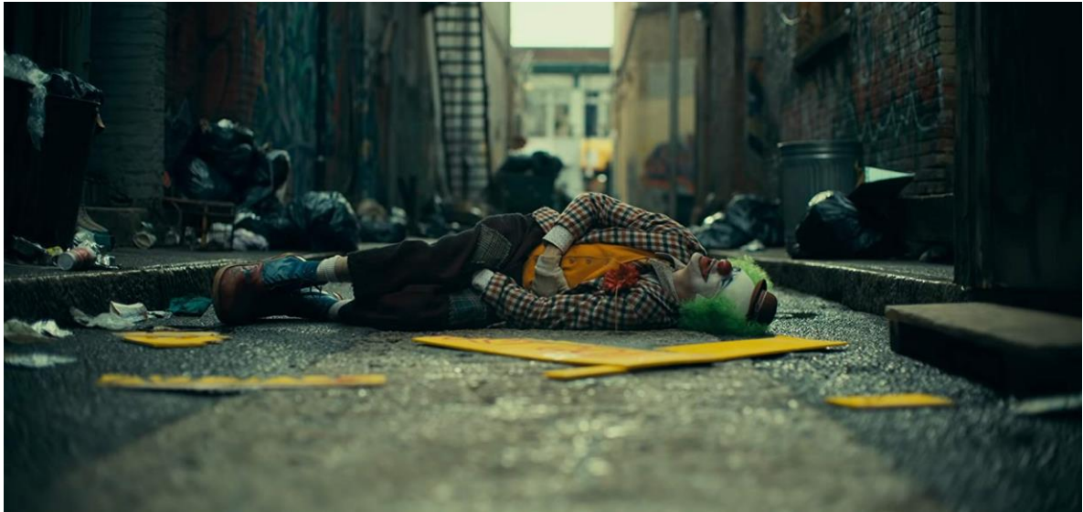
Figura 3: Escena de Joker (2019) Dirección Todd Phillips

He ahí el inicio de la tesis de esta obra. Y digo obra como el resultado de un saber hacer de quienes la construyeron, empezando por un señor actor como lo es Joaquín Phoenix, quien logra lo que muchos consideramos imposible: colocarse a la par del mítico Guasón de Heath Ledger. Ambos artistas alcanzan el Olimpo de las artes, desde espacios diferentes: mientras Ledger es el señor del Tártaro, el magistral Phoenix marca el inicio del descenso al inframundo. Para ello, lleva la actuación a otro nivel, a una composición de cuerpo y estructura interpretativa como pocas veces hemos visto en el cine, excepto en aquellos artistas que pasan al nivel de leyenda.