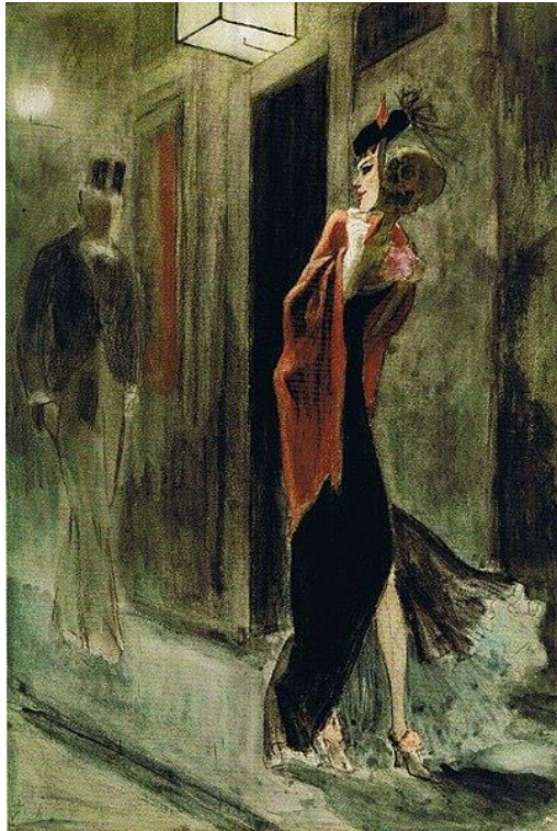
Figura 1: Felicien Rops La parodia humana (1878-1881)

Era el desliz del progenitor, y tal como los niños espartanos deformes, que amenazaban el ideal cultural, eran expulsados, alejados del paraíso de la aceptación.