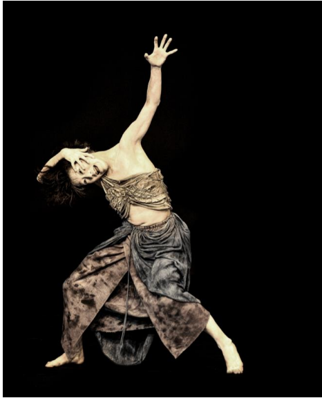
Figura 5: Danza-butoh 23