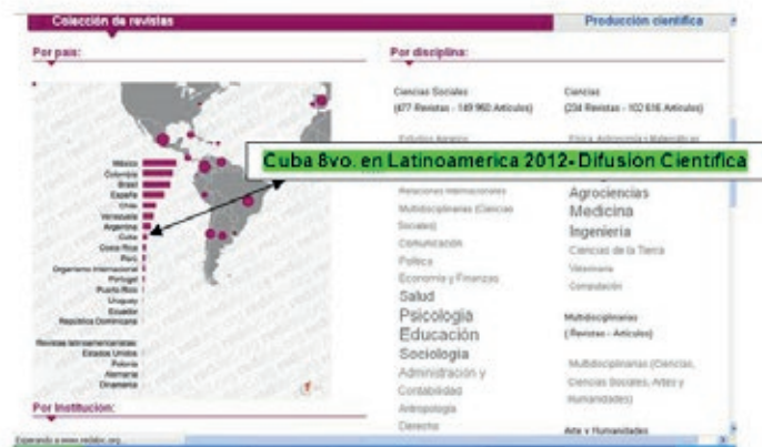
Figura 1.

El posicionamiento en difusión, es un indicador importante para la producción científica, uno de sus exponentes más emblemático y propiciador de altos índices de producción científica. En la comunidad científica Latinoamericana la Red de Revistas Científicas de América Latina y el Caribe, España y Portugal, (Redalyc) ubica a Cuba en el 8vo. lugar, según datos de 2012, evidenciados a partir del total de publicaciones cubanas que existen en este repositorio, 22 revistas en total. Los criterios que establece esta plataforma difusora están implementados en las publicaciones cubanas en correspondencia a los modelos de comunicación científica establecidos por la comunidad internacional. (ver figura 1.)