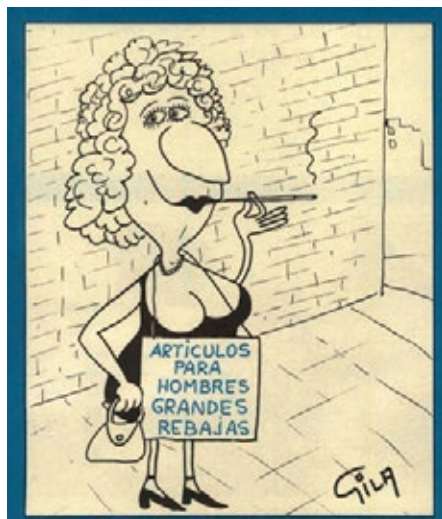
Imagen 5: Las mujeres están reservadas para empleos tradicionalmente asociados al género femenino. Viñeta de Gila, 3 de marzo de 1973.

Por último, cuando la mujer ocupa el rol de profesional, se limita a una serie de puestos de trabajo tradicionalmente asociados al género femenino representados como empleos que no requieren esfuerzo o se encuentran relacionados con realizar las labores del hogar como, por ejemplo, dependienta, secretaria, criada o prostituta.