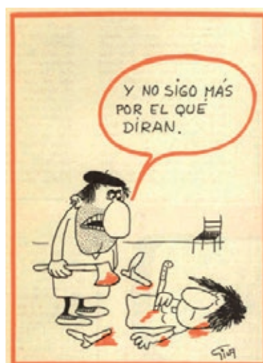
Imagen 4: Los humoristas muestran la violencia hacia la mujer dentro del matrimonio de manera explícita. Viñeta de Gila, 9 de junio de 1972.

En el rol de esposa hasta la muerte, la mujer se enfrenta a la violencia verbal y física del marido, con una gran dosis de humor negro, de la mano de autores como Chumy Chúmez o Gila. Estas situaciones desapacibles se dan dentro la institución del matrimonio, uno de los pilares del franquismo.