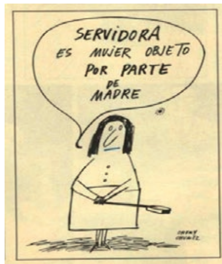
Imagen 3: La mujer ejerce de ama de casa, madre y esposa. Viñeta de Chumy Chúmez, 3 de marzo de 1973.

Esa imagen de esposa se repite en el caso de la mujer que juega el rol de madre. Normalmente se trata de mujeres desaliñadas, de mediana edad, que se dedican al cuidado de sus hijos, de su marido y de su casa. Muy relacionado con el rol de madre están los roles de ama de casa y de esposa hasta la muerte. El primero se presenta como la mujer dedicada a servir a un marido, el cual desprecia y critica la labor de ella. Este tipo de mujer se ubica en situaciones cotidianas contextualizadas en el hogar.