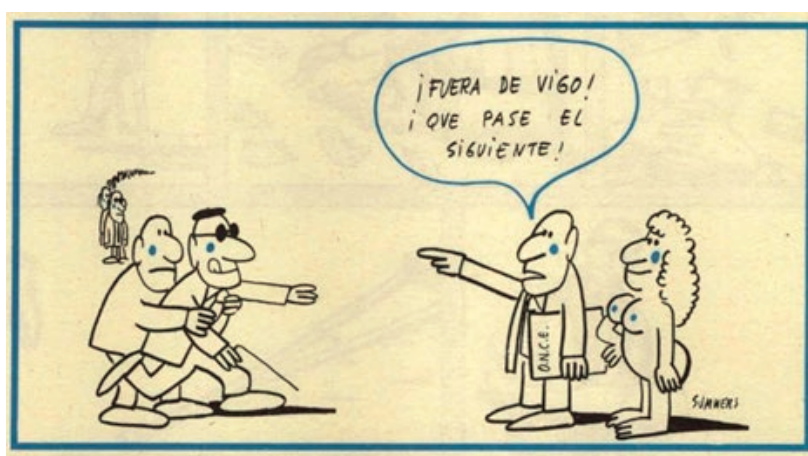
Imagen 2: La mujer ejerce un papel secundario y sin voz. Viñeta de Summers, 9 de febrero de 1972.

Dentro de la revista de humor Hermano Lobo , encontramos una escasa relevancia de la figura de la mujer, confirmada por el bajo número de viñetas protagonizadas por personajes femeninos que hemos encontrado. En la mayoría de escenas, la mujer ejerce de figurante silenciado, simplemente acompañando y apoyando al hombre. Los roles que adopta la mujer en las diferentes piezas que se han analizado confirman su posición a la sombra del hombre en prácticamente la totalidad del material revisado. Respecto al rol de mujer objeto, se muestran dos tipos. Uno asociado a personajes femeninos que ejercen de esposas dedicadas a las labores del hogar y a sus hijos. El otro está representado a través de chicas jóvenes, vestidas de un modo más atrevido para la época, en las que los hombres piensan como objeto sexual.