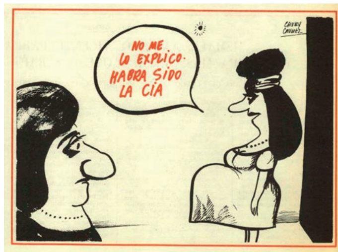
Imagen 7: Las relaciones sentimentales son la temática recurrente de las viñetas en las que aparecen mujeres. Viñeta de Chumy Chuméz, 6 de marzo de 1976.

La segunda temática abarca las relaciones matrimoniales. Hermano Lobo presenta la institución matrimonial como unión que dura para siempre basada en escenas violentas que muestran el maltrato hacia la mujer o escenas más agradables, pero que reflejan relaciones muy desgastadas donde el romanticismo no existe. Las relaciones extramatrimoniales aparecen en la revista tanto por parte de la mujer como por parte del hombre, aunque especialmente en el caso del género masculino. En el caso de la mujer, la infidelidad dentro del matrimonio acostumbra a darse en el hogar mientras que el hombre puede manifestarla en otras ubicaciones, se trata de una infidelidad más libre. Asimismo, la mujer siempre es sorprendida por el marido.