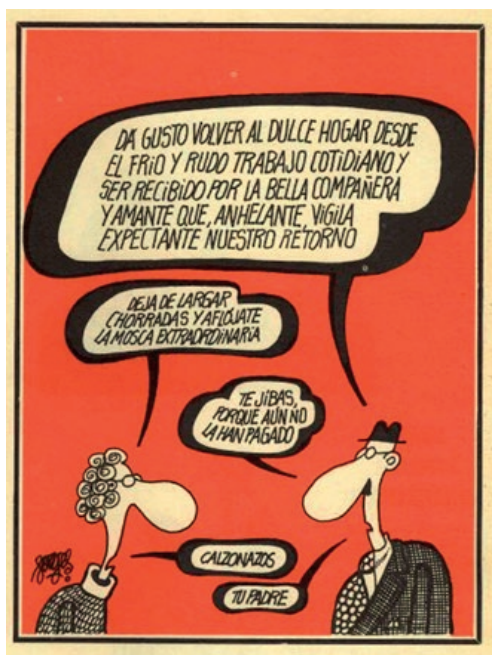
Imagen 6: La ironía, la exageración y el doble significado son los recursos más utilizados en las viñetas de Hermano Lobo. Viñeta de Forges, 23 de diciembre de 1972.

El sarcasmo está presente en las viñetas que muestran el maltrato (consentido socialmente) del hombre hacia la mujer, fruto del machismo y del abuso del poder del hombre. Las viñetas son muy explícitas con escenas de gran brutalidad. Observamos en diferentes ejemplos como el hombre ejerce violencia física sobre la mujer con objetos como palos o cuchillos y la presencia de amenazas verbales.